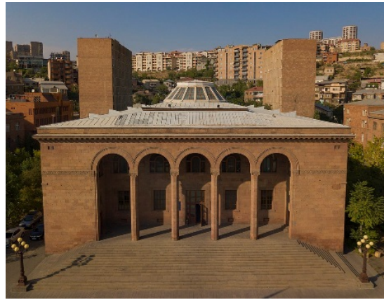
ՀՀ Գիտությունների ակադեմիայի շենքը, 1954 թ.