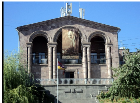
Թումանյանի տուն-թանգարանը, 1944-53 թթ.