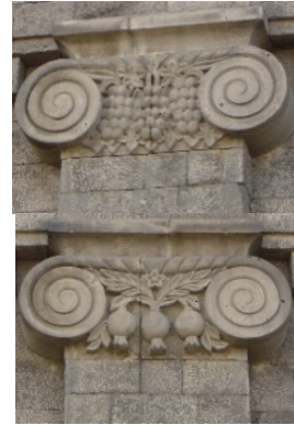
ա) «Արարատ» տրեստի գինու գործարանի շենքը, 1938, 1945-63 թթ.