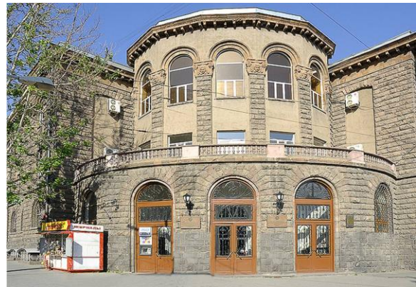
Մանկական հիվանդանոցի շենքը, 1935-38 թթ.