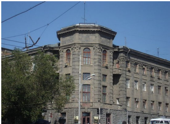
Հայկերգրի շենքը, 1937 թ.