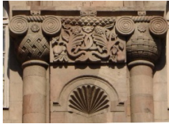
Կառավարական տուն, 1926-1940 թթ.