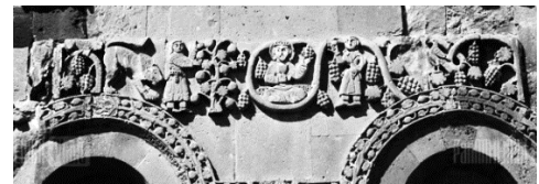
Զվարթնոցի (7-րդ դ.), Աղթամարի (9-րդ դ.) զարդաքանդակները