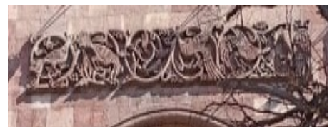
Կառավարական տան որմնախոյակներն ու զարդագոտին