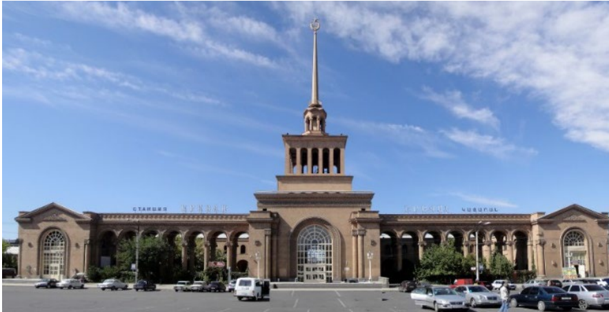
Երկաթգծի կայարանի շենքը, 1949-55 թթ.