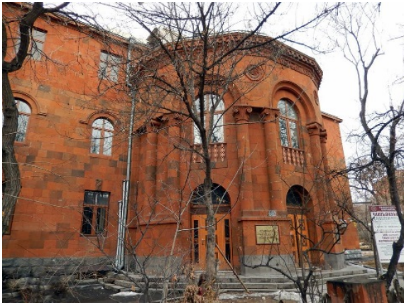
Գրողների միության շենքը, 1946 թ.