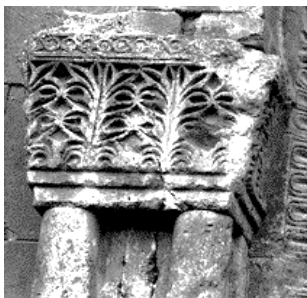
Տեկորի տաճար (5-րդ դ.)

Թվարկված այս սկզբունքները նա կիրառեց իր երկու կարևոր կառույցներում՝ Կառավարական տան և ժողովրդական տան (Օպերայի և բալետի ազգային ակադեմիական թատրոն) նախագծերում: Երկու կառույցներն էլ տարածաստեղ են՝ կազմակերպելով քաղաքի գլխավոր և թատերական հրապարակները: Ճակատների մշակումներում առկա են դասական ճարտարապետությանը բնորոշ կամարաշարերի, բաց պյունասրահների մետրիկ շարքեր: Գեղարվեստական արտահայտչականության մեջ կարևոր դերակատարում ունեն մի դեպքում տուֆը, մյուսում՝ բազալտը: Թամանյանը դասական սկզբունքների վրա հիմնված այս կառույցների հարդարանքում կիրառել է հայկական միջնադարյան ճարտարապետության տարբեր կառույցների զարդաքանդակներ, իհարկե՝ ստեղծագործաբար մշակված (Տեկորի, Զվարթնոցի, Աղթամարի եկեղեցիներ) (նկ. 2) [17]: