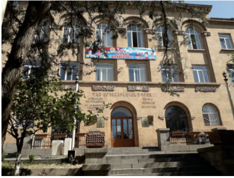
Կամոյի (Արզենտինական) դպրոցը