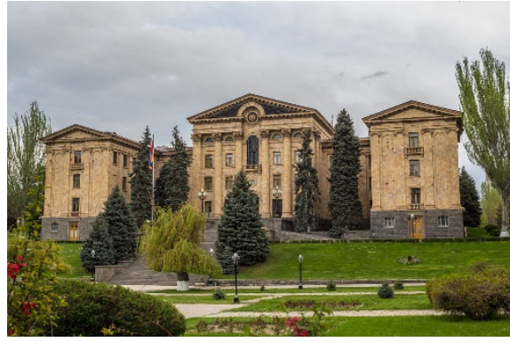
Ազգային ժողովի շենքը, 1949 թ.