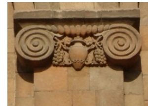
բ) Կոնյակի գործարանի շենքը, 1944-52 թթ.