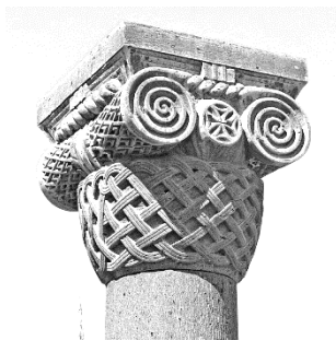
Զվարթնոցի տաճար (7-րդ դ.)