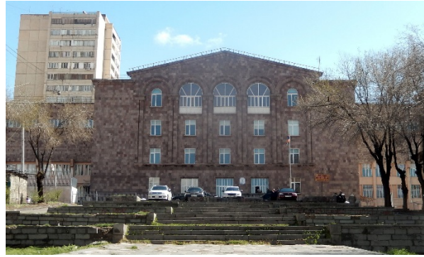
Չերժինսկու (Չ. Կիրակոսյանի) դպրոցը