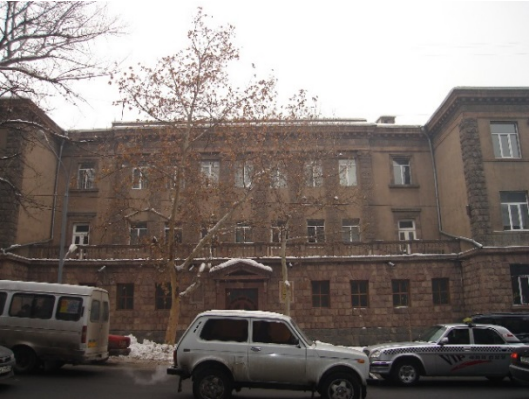
Կրուպսկայայի (Ն. Աղբալյան) դպրոցը

Դպրոցները հիմնականում ունեն ճակատային, դասական ճարտարապետությանը բնորոշ համաչափ հորինվածք՝ գլխավոր ճակատով ուղղված դեպի բակ և փողոց: Համաչափության առանցքն ընդգծված է որոշ կառույցներում՝ ճակտոնով, որոշներում՝ կողային ռիզոլիտներով: Գլխավոր ճակատները մշակված են երկհարկ բարձրություն ունեցող որմնապույունների կամ որմնականարների մետրիկ շարքերով, ինչը նույնպես բնորոշ է դասական ճարտարապետությանը: Ազգային և թամանյանական ճարտարապետության հետ աղերսներ ունեն որմնախոյակների, իսկ Չեխովի դպրոցում՝ նաև կամարաշարերի վերին գոտու զարդաքանդակները: Ուսումնական այդ շենքերն իրենց հորինվածքով, որմնականարաշարերի հարդարանքով մոնումենտալ են և կանոն դիրք ունեն փողոցների կազմակերպման մեջ (նկ. 5):