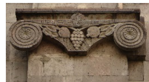
դ) Սառցակուրբինատի շենքը, 1951թ.