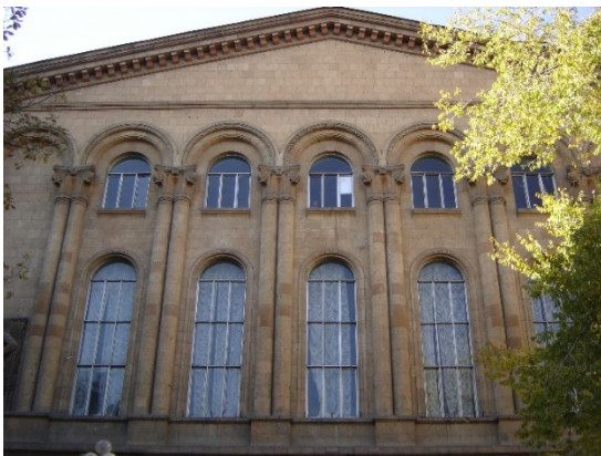
Կանազի մշակույթի տունը, 1953-54 թթ.