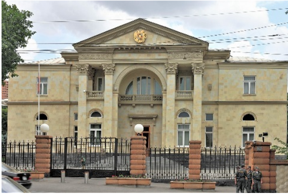
Նախագահության շենքը, 1951-53 թթ.