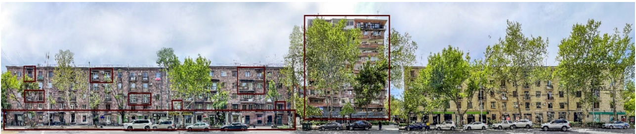
Նկ. 2. Մայրթ - Նովա փողոցում շենքերի ճակատների հորինվածքային ամբողջականության կազմաքանդման դեպքեր

Զարգացման ներկայիս փուլում շենքերի ճակատների բաղադրիչները (պատշգամբների ձևեր, բացվածքների համաչափություններ, դեկորացիաներ, նկարվածքներ, օգտագործված նյութեր), ըստ հորինվածքային օրինաչափության և ներդաշնակության չափանիշներին ենթարկվելու մակարդակի, սահմանում են միջավայրի գեղագիտական որակը՝ բարելավելով կամ նսեմացնելով այն (նկ. 2):