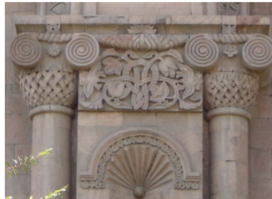
Կառավարական 1-ին տուն