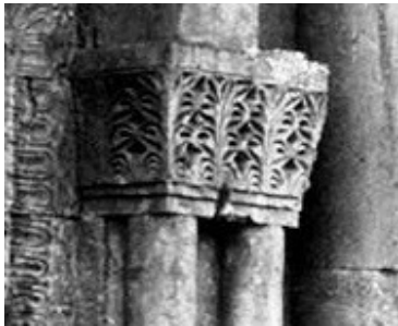
Տեկորի տաճար (5-րդ դ.)

Կառավարական 2-րդ տան ճակատային հորինվածքի ուղղաճիճ մասը նույնպես ենթարկված է կամարաշարերով մետրիկ ջլատումների՝ առաջին և երկրորդ հարկի մակարդակով անցնում է զույգ սյուներով կամարաշարը: Զույգ սյուներով որմնասյուների խոյակը երկմաս է. մեկ ընդհանուր քառանկյուն վերնասալի տակ ամփոփված են զույգ սյուները պսակող քանդակազարդ խոյակները, որոնցում տեղ է գտել զարդարվեստում, ինչպես նաև հայկական միջնադարյան ճարտարապետության մեջ ընդունված զույգ ծաղիկների բուսական զարդամոտիվը [16]: Այն, կարելի է ենթադրել, ստեղծվել է Զվարթնոցի տաճարի, Թալինի Մայր տաճարի արտաքին պատերի որմնասյուների ստեղծագործական մշակման արդյունքում (նկ. 5):