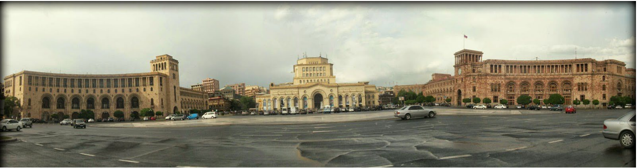
Նկ. 2. Հանրապետության հրապարակը

թյունը: Հրապարակի կորագիծ ծավալների ուրվագծի դինամիկ զարգացումը մարում է՝ հանդիպելով թանգարանի շենքի ստատիկ զանգվածեղ ծավալին: Հրապարակի ողջ ուրվագիծը ձևավորվում և զարգանում է միննույն բարձրությամբ կապի և հյուրանոցի շենքերով, այնուհետև այդ դինամիկան ուղղորդվում է դեպի կառավարական շենքերը, հանդիպելով ուղղաձիգ աշտարակներին՝ «հավասարակշռության նժարներին», ավելի ցածր ուղղագիծ ծավալներով ուղղվում է դեպի թանգարանի ստատիկ ծավալը: Ուրվագծի նման զարգացմամբ էլ ողջ միջավայրում դոմինանտ է դառնում թանգարանի շենքը (նկ. 2):