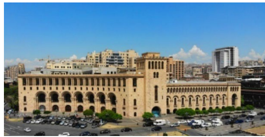
Կառավարական 2-րդ տունը