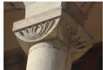
Կառավարական 2-րդ տուն