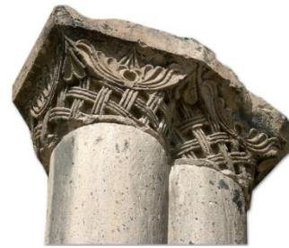
Թալինի Մայր տաճար (7-րդ դ.)