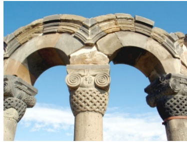
Զվարթնոցի տաճար (7-րդ դ.)