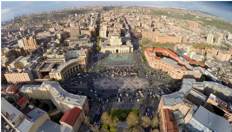
Նկ. 1. Երևանի հանրապետության հրապարակը

Համաշխարհային ճարտարապետության մեջ բազմաթիվ են շրջանաձև կառուցապատում ունեցող հրապարակների օրինակները: Դրանք հանդիպում են հատկապես վերածննդի, բարոկկոյի և կլասիցիզմի շրջաններում: Ինչպես Երևանի, այնպես էլ բազմաթիվ քաղաքների գլխավոր հրապարակներն ունեն լայնարձակ պարագծային կառուցապատում, հերոսական մասշտաբից բխող մոնումենտալություն և հորինվածքային ամբողջականություն: Լավագույն օրինակներից են Սբ Պետրոսի տաճարային հրապարակը Հռոմում, Պալատական հրապարակը Սանկտ Պետերբուրգում, Համաձայնության, Աստղի, Իտալիայի, 16-րդ կորպուսի հրապարակները Փարիզում և այլն [6]: Խորհրդահայ շրջանում Երևանում նույնպես ստեղծվեցին մեծ ու փոքր շրջանաձև հորինվածքով հրապարակներ՝ Հանրապետության, Գարեգին Նժդեհի, Շարռլ Ազնավուրի, Սախարովի և այլն: