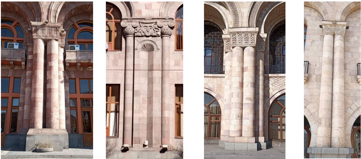
Նկ. 4. Կառավարական 1-ին և 2-րդ տների որմնասյուները