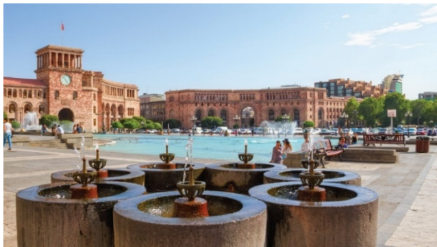
Նկ. 4. Հանրապետության հրապարակ շրջակայքի վարչական շենքերի համալիր [6]

Հետագոտության ընթացքում իրականացված վերլուծությունը ցույց է տալիս, որ 20-րդ դարի ճարտարապետական ժառանգության պահպանությունը հանդիսանում է բազմաշերտ և բարդ գործընթաց, որը պայմանավորված է ինչպես օբյեկտիվ, այնպես էլ սուբյեկտիվ գործոններով: