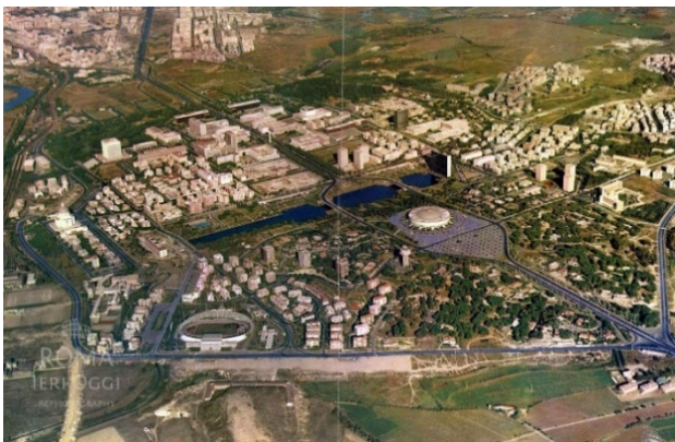
Նկ. 5. EUR թաղամասի քաղաքային տեսարաններ (1940–1960-ականներ)

Իտալիայում հասարակությունը մեծապես գիտակցում է նույնիսկ 20-րդ դարի ժառանգության արժեքը: Հայաստանում նկատվում է փոփոխվող պատկեր՝ աճող հետաքրքրություն խորհրդային մոդեռնիզմի նկատմամբ, երիտասարդ սերնդի ներգրավվածություն: 20-րդ դարի առաջին կեսում, հատկապես Բենիտո Մուսոլինիի իշխանության տարիներին, Իտալիայում կառուցվեցին բազմաթիվ պետական շենքեր՝ մոնումենտալ և ռացիոնալիստական ոճով: Օրինակ՝ EUR թաղամասը ( Esposizione Universale Roma ) յուրահատուկ թաղամասերից է, որը խիստ տարբերվում է քաղաքի պատմական կենտրոնից: EUR թաղամասի սկզբնական կառուցվածքը եղել է՝ լայն ուղիղ պողոտաներով, խիստ սիմետրիկ պլանավորմամբ և մեծ կանաչ տարածքներով: 1940-ականներին այն դեռ մասամբ կառուցման փուլում էր, քանի որ նախատեսված էր 1942-ի համաշխարհային ցուցահանդեսի համար, որը չկայացավ Երկրորդ համաշխարհային պատերազմի պատճառով: 1950–60-ականներին արդեն ձևավորվում են բնակելի զանգվածներ՝ շրջապատված վարչական ու մոնումենտալ շենքերով (նկ. 5): EUR-ը նախագծվել էր որպես «իդեալական քաղաք»՝ համատեղելով դասական հռոմեական ոճը և 20-րդ դարի ռացիոնալիստական ճարտարապետությունը: Բնակելի թաղամասերը հաճախ տեղակայված էին խոշոր պետական ու ցուցադրական շենքերի շուրջ՝ ստեղծելով լայն, բաց և կարգավորված տարածքներ: Այն գտնվում է Հռոմի հարավային հատվածում և այսօր հանդիսանում է բիզնես և վարչական կենտրոն, բնակելի թաղամաս, ճարտարապետական կարևոր համալիր (նկ. 6) [7]: