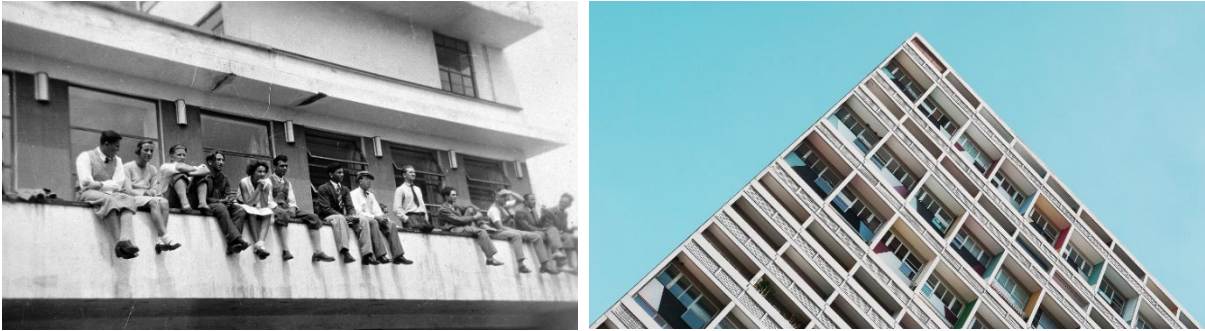
Նկ.8. Բաուհաուսը՝ Շինարարության գեղարվեստական ձևաստեղծման բարձրագույն դպրոց Տշենը, որը միավորում է բոլոր բնագավառներն ու արհեստները՝ [11]

Միջազգային փաստաթղթերը ցույց են տալիս, որ ժառանգության ընդհանուր սահմանումները չափազանց լայն են, պետություններին թողնված է որոշակի չափանիշների մշակում, իսկ 20-րդ դարի ժառանգությունը պահանջում է առանձնահատուկ մոտեցումներ: