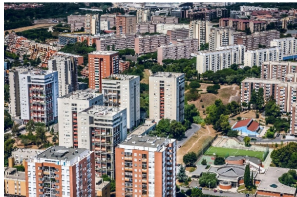
Նկ. 6. Հռոմի արևմտյան մասում գտնվող EUR թաղամասի բնակելի շրջաններ [7]