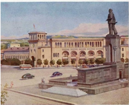
Նկ. 3. Խորհրդային շրջանում այն հայտնի էր որպես Լենինի հրապարակ

Հանրապետության հրապարակը խորհրդանիշ է Հայաստանի պետական ինքնության և անկախության: Խորհրդային շրջանում այն հայտնի էր որպես Լենինի հրապարակ, սակայն 1991-ին վերանվանվեց ի պատիվ անկախ Հայաստանի Հանրապետության (նկ. 3, 4), [6]: Այսօր այն համարվում է ոչ միայն զբոսաշրջային կենտրոն, այլև ազգային հավաքատեղի՝ միավորելով մշակութային և քաղաքական նշանակությունը: