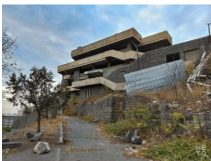
Նկ. 1. Երիտասարդական պալատը՝ կառուցված 1970-ականներին