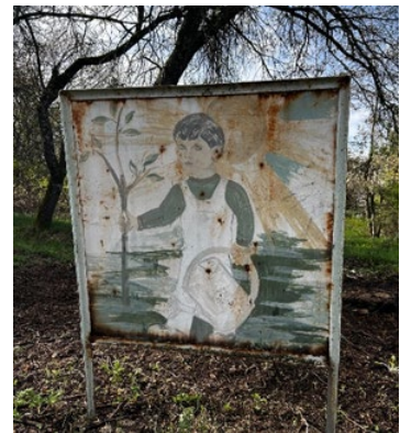
Նկ. 5. Առողջարանի ցուցանակը

Հայրավանքի առողջարան: Առողջարանը գտնվում է Հայրավանքի տարածաշրջանում, անմիջապես Սևանա լճի հարավային ափին, բացառիկ բնապատկերային և մշակութային միջավայրում: Խորհրդային ժամանակաշրջանում այստեղ կառուցվել էին նաև զբոսաշրջային բազա և մանկական պիոներական ճամբար, սակայն 2000-ական թվերին, Սևանա լճի ջրի մակարդակի բարձրացման հետևանքով, տարածքի 8 շինություններից 7-ը հայտնվել են ջրի տակ: Մինչ այդ տարածքը ժամանակավորապես օգտագործվել է նաև կաթնամթերքի արտադրությամբ զբաղվող ֆերմայի համար: