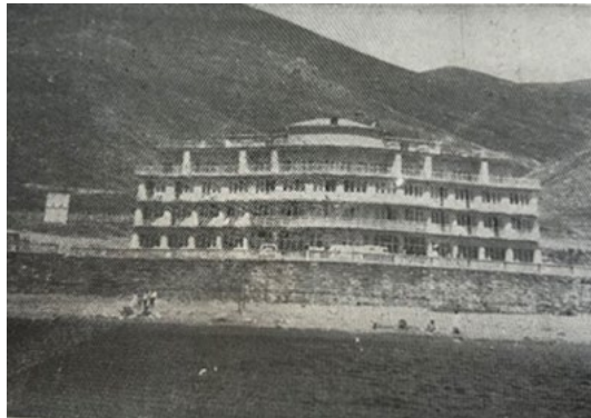
Նկ. 2. «Արևիկ» պիոներական ճամբար

«Արևիկ» առողջարան: Արևիկ առողջարանը գտնվում է Գեղարքունիքի մարզում, Սևանա լճի ափին՝ Սևան-Ճամբարակ ճանապարհահատվածի 8-րդ կմ-ի վրա: Անվանումն ինքնին՝ «Արևիկ», պայմանավորված է նրանով, որ այստեղ գրեթե ամբողջ օրն արևոտ է: