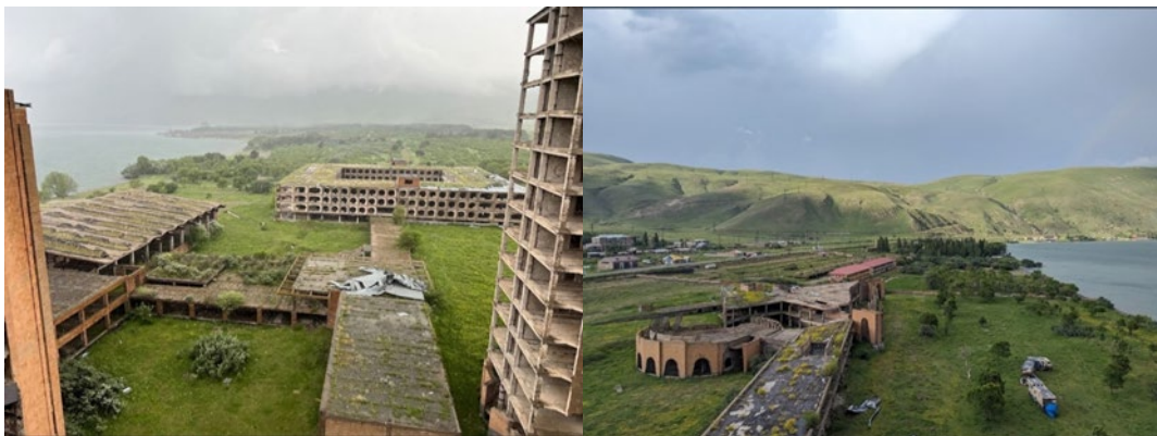
Նկ. 4. Զբոսաշրջային բազան, բազայի հյուսիսային հատված

Սևանի ափին գտնվող կիսակառույց առողջարանային շինություններ: 1980-ական թվականներին Սևանի ափին նախատեսվում էր կառուցել առողջարաններ և հանգստյան բազաներ՝ նպաստելու առողջարանային զբոսաշրջության զարգացմանը: Սակայն Խորհրդային Միության փլուզման հետևանքով բազմաթիվ նախագծեր կիսատ մնացին: Այդպիսի օբյեկտներից է չկառուցված առողջարանը, որի ճարտարապետի և պաշտոնական անվան վերաբերյալ հստակ տվյալներ չեն պահպանվել: Որոշ աղբյուրներում նշվում է, որ այն կարող էր պատկանել ЛНПО-Лечебно-научно-производственное объединение «Ավանգարդ» հանգստյան բազայի ցանցին, սակայն այդ տեղեկությունը փաստագրական հաստատում չունի [13, 14]: Չնայած անավարտ շինարարությանը, առողջարանի լքված կառույցը շարունակում է գրավել այցելուներին իր անսովոր տեսքով, հիշեցնելով խորհրդային առողջարանային ծրագրերի և չիրականացված զբոսաշրջային զարգացման հնարավորությունների մասին (նկ. 4): Սևանի հյուսիսարևմտյան ափին գտնվող այս օբյեկտները կարող են վերաիմաստավորվել և ինտեգրվել ժամանակակից զբոսաշրջային և առողջարանային ծրագրերին՝ վերածվելով մշակութային ու զբոսաշրջային նշանակության կետերի: Այս կառույցները Սևանի զբոսաշրջային ժառանգության կարևոր մաս են կազմում՝ վկայելով անցյալի մեծամեծ ծրագրերի և ժամանակակից զբոսաշրջության զարգացման հնարավորությունների մասին: