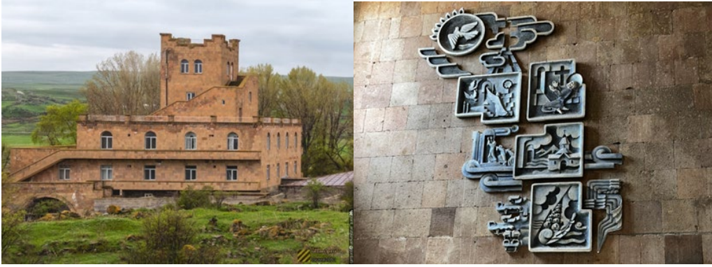
Նկ. 5. Հայրավանքի առողջարանը և միջանցքի պատերին քանդակված պատկերները

Այսօր պահպանված միակ շինությունը հենց առողջարանն է, որը կառուցված է ամրոցի ոճով, հարևանությամբ գտնվում են անավարտ լողավազանն ու սպորտսրահը: Շինությունը բարեկեցիկ վիճակում է, վերանորոգումից հետո հնարավոր է այն օգտագործել որպես առողջարանային կամ զբոսաշրջային կենտրոն: