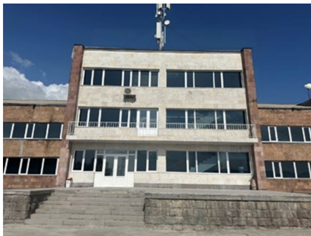
Նկ. 3. «Արևիկ» առողջարան

1968 թ. այն գործել է որպես «Արևիկ» պիոներական ճամբար (նկ. 2), որն իր ժամանակաշրջանում մեծ հռչակ ունեցող մանկական հանգստի կազմակերպման կենտրոն էր: Սակայն հետագա տասնամյակների ընթացքում ճամբարը վերափոխվեց, 1983 թ. այն վերանվանվեց և դարձավ առողջարան, որն արդեն ծառայում էր ոչ միայն երեխաների, այլև մեծահասակների վերականգնման և բուժման նպատակին: Խորհրդային տարիներին «Արևիկ» առողջարանը մասնագիտացված էր տարբեր բուժական մեթոդների վրա՝ առաջարկելով ֆիզիոթերապիա, ջրաբուժություն, մերսում և դեղորայքային էլեկտրոֆորեզ, աղաբուժություն, բուժում գերբարձր հաճախականությամբ, գալվանացում, դարսոնվալիզացիա, պարաֆինոթերապիա: Այստեղ բուժվում էին մի շարք հիվանդություններ, այդ թվում՝ բրոնխային ասթմա, նյարդային համակարգի հիվանդություններ, հենաշարժական խնդիրներ, մանկական ուղեղային կաթված, օրթոպեդիկ և ալերգիկ հիվանդություններ, բերանի խոռոչի լորձաթաղանթի հիվանդություններ, հայմորիտ, հենաշարժական ապարատի, հոդատապի, ճարպակալման, մանկական ալերգիկ հիվանդություններ, ողնաշարի հիվանդություններ, քիթ-կոկորդ-ականջի մանկական հիվանդություններ: