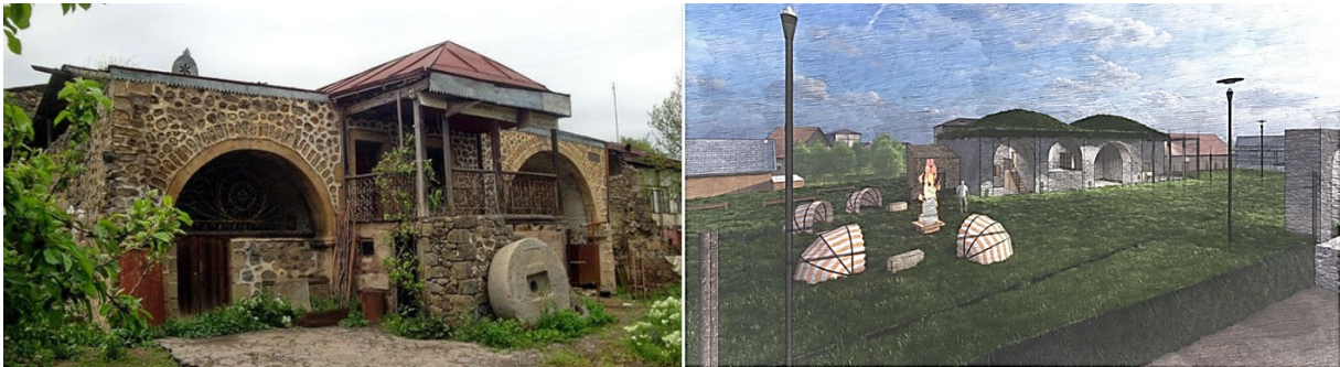
Նկ. 3. Իրավիճակային լուսանկար, առաջարկվող վերականգնման եռաչափ տարբերակ

Տարածքը պահպանվելու է էլեկտրական հովիվներով, որը թույլ չի տա կենդանիների մուտքը դեպի մելիքական ապարանք: Նախատեսվում է ստեղծել էկո-կայանատեղի, որի նպատակն է, պահպանելով կանաչապատ տարածքները, ունենալ ավտոկայանատեղի: Իրականացվելու են ճանաչողական զբոսաշրջային բացօթյա ճամբարներ: